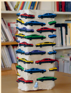
D'après l'œuvre Long term parking d'Arman

Toutes les propositions sont gratuites sauf mention contraire.