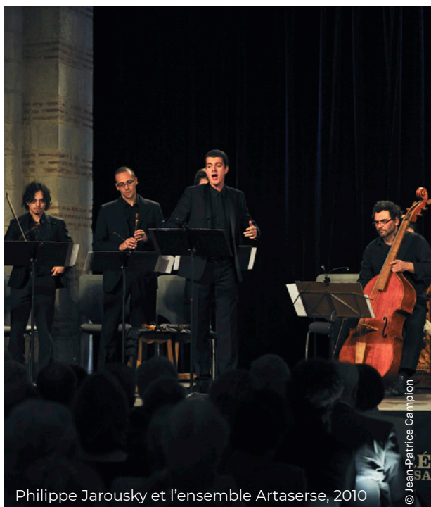
Philippe Jarousky et l'ensemble Artaserse, 2010

Création de la saison musicale de la collégiale « Les Résonances Saint-Martin » qui marquent le démarrage de la diffusion artistique du monument et affirme l' identité musicale du site .