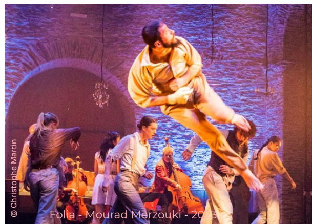
Folia - Mourad Merzouki - 2013

Tournant dans la saison musicale qui devient la saison artistique de la collégiale , avec ouverture de la programmation à la croisée des arts autour de 3 axes forts : les musiques (baroque, jazz, musiques actuelles, musiques du monde...), les voix (lyrique, choral, beat box...) et les arts du mouvement (la danse contemporaine, la danse baroque, le hip-hop...).