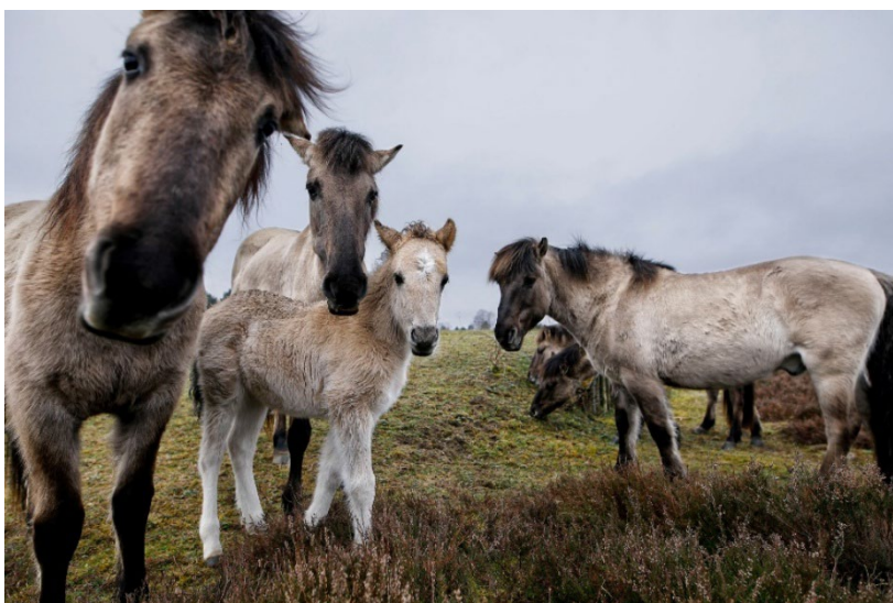
Six tarpans vivent à Boudré